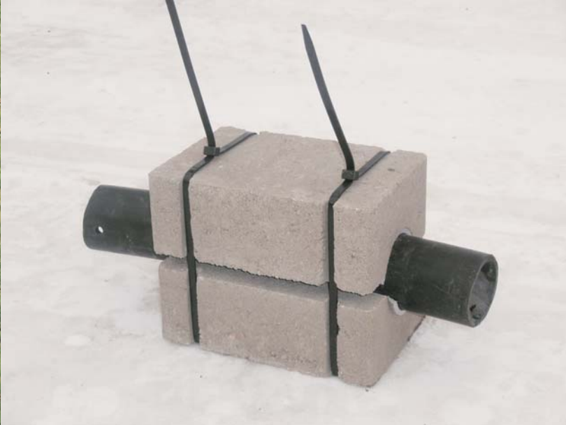
Nippusidepaino 50 ja 63 mm putkille, 6,8 kg

Lujabetoni Oy:n nippusidepainot on suunniteltu kaikenlaisten putkien vesistöihin upottamista varten. Käyttökohteita ovat mm. maalämpö-, vesijohto- ja viemäriputket.